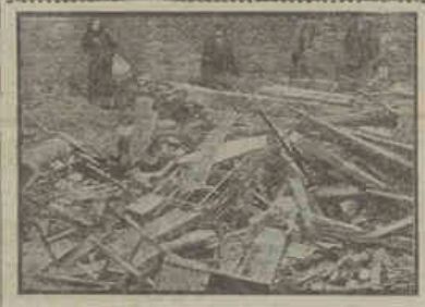
Una muestra de la «Revolución Socialista»