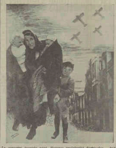
La reacción fascista persigue a los jóvenes proletarios destruyéndolos... Jaén, Bilbao, etc.