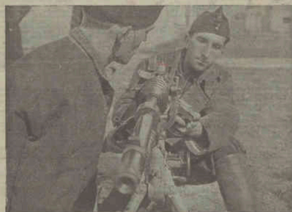
Podrá nuestra camarada conocer perfectamente su tipo de arma. Para ello, acuden a nuestras clases prácticas de educación militar.

“La salud de la Revolución exige imperiosamente que las armas estén en poder de la juventud obrera y campesina y el pico y la pala, en manos de la juventud burguesa”