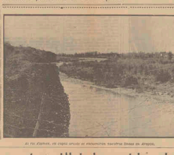
El río Euzkadi, en estos días se encuentran nuestras líneas en Aragón.