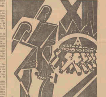
«¡Qué bien, qué bien se destruyeron los cuarteles en el frente de Aragón! ¡Para ayudar a Carrillo! ¡Ojalá en el frente de Aragón!...