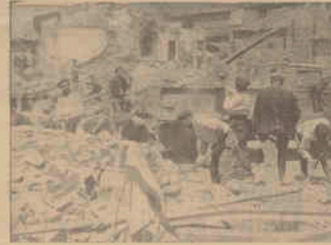
Obrero trabajando en el desescombre del Hospital de Añel, destruido recientemente.