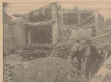
La aviación negra ha destruido un objetivo: el hospital de Añel destruido.